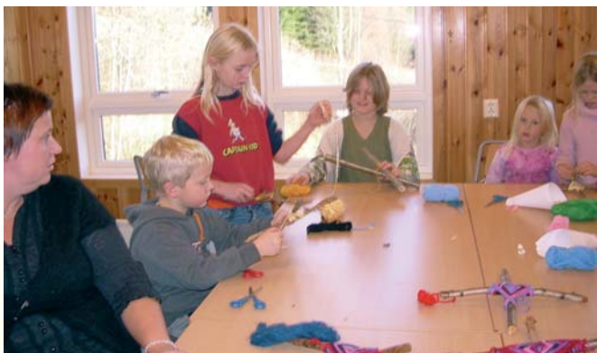
4. klasse hadde "Vev" på formingsrommet.

Tradisjonen tro gjennomfører skolen en solidaritetsaksjon hvert år. I år var medlemmene av elevrådet ikke i tvil, de ønsket at årets aksjon skulle øremerkes "Leger uten grenser".