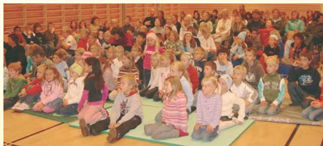
Vinner jeg i år tro?