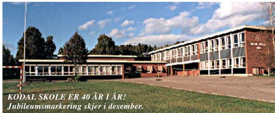
KODAL SKOLE ER 40 ÅR I ÅR! Jubileumsmarkering skjer i desember.

Beliggenheten var et lykkelig valg i 1966. Hvitstein og Prestbøen skoler ble avviklet, og en helt ny skole ble bygget der den nå ligger.