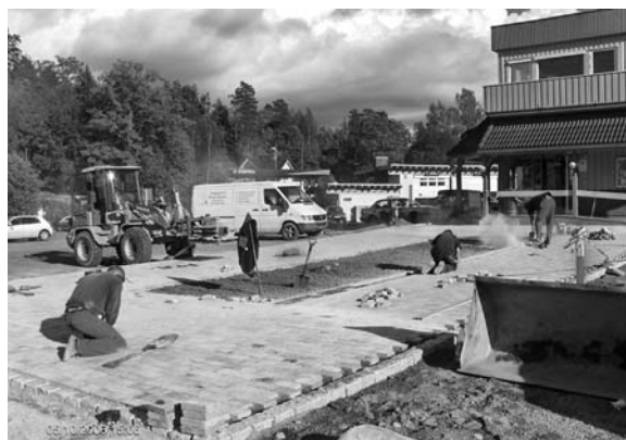
Fra arbeidene utenfor Meny, Foto: Asmund Sletvold

Arbeidet medfører også et nytt mønster vedr. parkering, da det ikke er "gjennomkjøring" foran hovedinngangen til Meny.